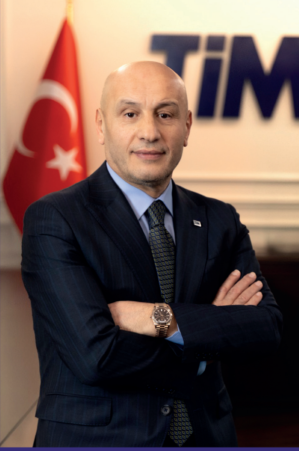
Mustafa Gültepe TİM Başkanı